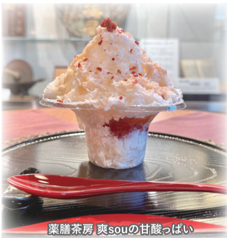
薬膳茶房 爽souの甘酸っぱい サンザシの薬膳かき氷900円

場所: さわら町屋館、 佐原商工会議所 時間: 10:00～17:00 引換え期間: 10月12日(祝)まで