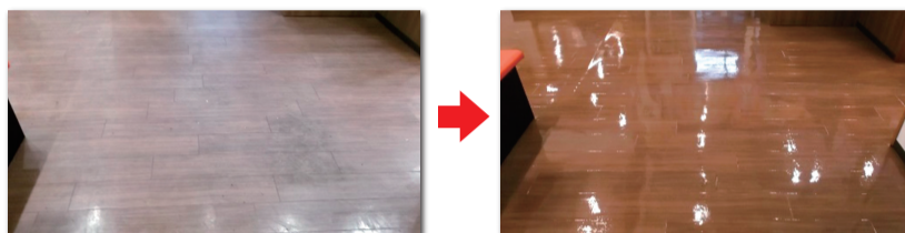
ラーメン店のしつこい油污れもこの通り綺麗になります。