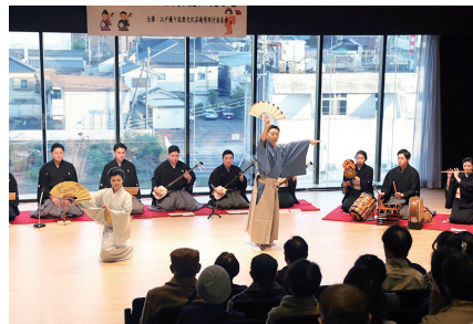
伝統文化・古典芸能に親しむ