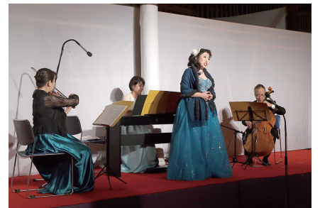
千葉交響楽団によるピアノ三重奏とソプラノ歌手の演奏