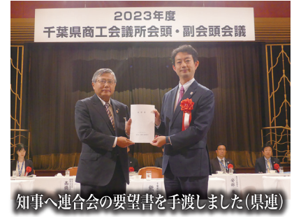
知事へ連合会の要望書を手渡しました(県連)

要望① 一般国道356号の篠原拡幅事業及び佐原・小見川間のバイパス化の早期事業化及び着手について要望する。