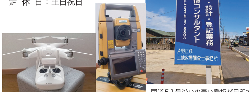
国道51号沿いの青い看板が目印です。

住所：成田市所 884 番地 11 TEL：0476-37-8803 営業時間：8：30～17：30 定休日：土日祝日