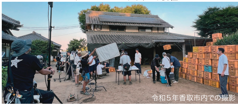
令和5年香取市内での撮影

ロケーションコーディネートとはCM・PV・MV・映画などの映像作品の背景となるロケーションを探し、監督や制作プロダクションに提案、安全に撮影遂行できるように管理進行する仕事です。