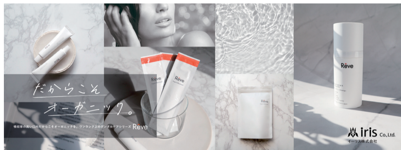
サロンで一番売れている最高峰のデンタルケアシリーズ (当社調べ)