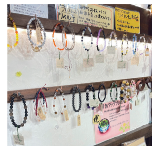
店長が一つ一つ丁寧に作成しています