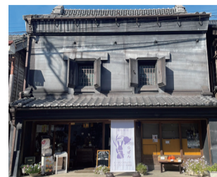
古民家をリノベーションした店舗