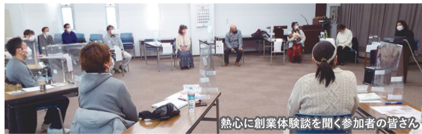
熱心に創業体験談を聞く参加者の皆さん