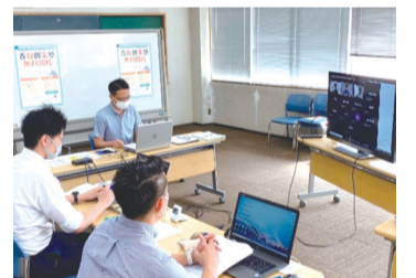
香取市商工観光課 商工企業誘致班 朝比奈班長による挨拶