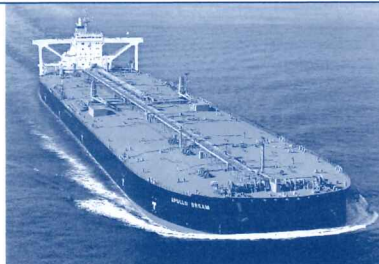
VLCC 'APOLLO DREAM' 31.2万トン 全長339.5m 幅60.0m (油輪船)