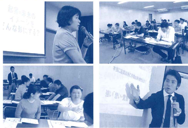
昨年度の創業セミナー 創業塾の様子 日程や講義内容は会議所だより6月号にて掲載予定!!

創業塾修了者には香取市内で会社を設立する際の登記にかかる登録免許税が軽減されるなどのメリットがある他、今年度より新設された香取市にぎわい再生支援事業補助金の申込資格が得られます。