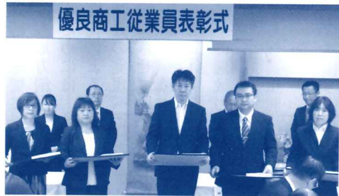
勤続30年以上の受賞者

中小企業庁 平成30年度補正予算事業 小規模事業者持続化補助金の公募が始まります。 ※地区内の商工会議所、商工会の確認及び押印が必要となります。 提出期限の2週間前を目安にご相談ください。