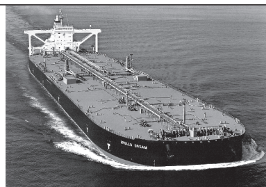
VLCC "APOLLO DREAM" 31.2万トン 全長339.5米 幅60.0米 (油槽船)