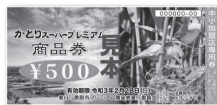
中小加盟店専用券

※全加盟店共通券と中小加盟店専用券の両方がご利用できる店舗と全加盟店共通券のみご利用できる店舗があります。