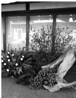
生花のモニュメント展示